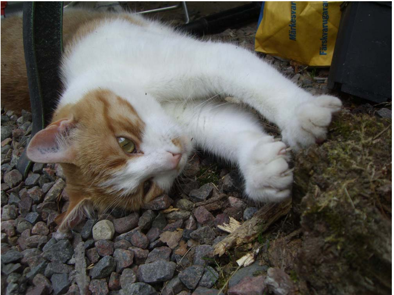
Ludde filar klorna på en liten stubbe