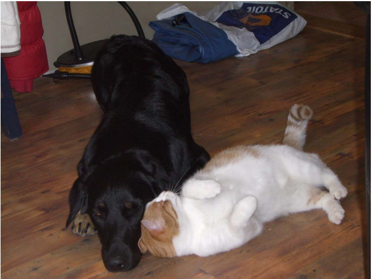
Ludde gosar med en trött Lowieh