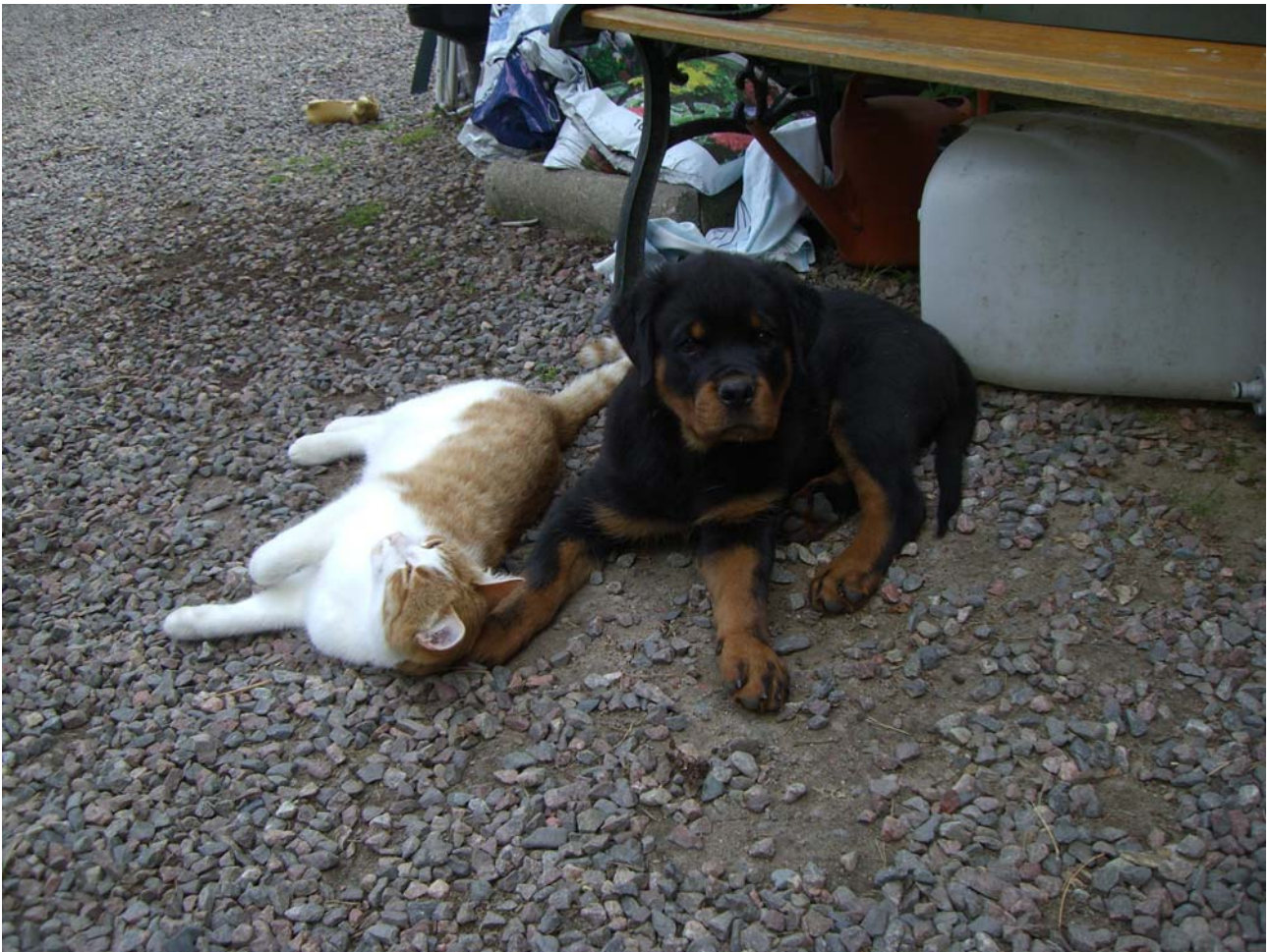
Ludde gosar med en förvånad valp (Bixi)