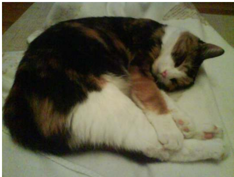
Dags för en tupplur...