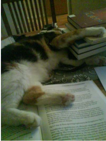
Matte pluggar jag vill vara med.