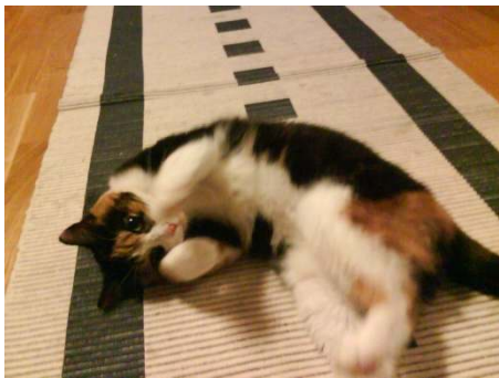
Dag 2 hos oss. Ett charmtroll.